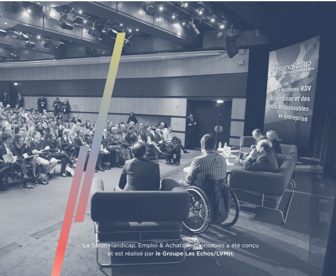
Le Salon Handicap, Emploi & Achats Responsables a été conçu et est réalisé par le Groupe Les Echos/LVMH.

6% de collaborateurs handicapés exigés en entreprise par la loi.